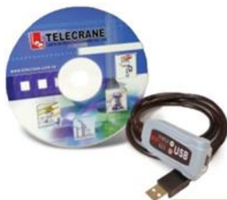
کابل پروگرام و CD