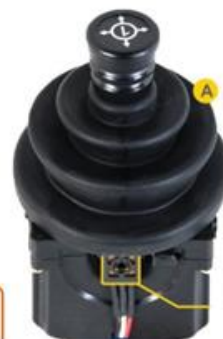
جوی استیک جدید

تلفن: 66828092 – 66817135 – 66814529 – 661943371 واتساپ: 09102117672