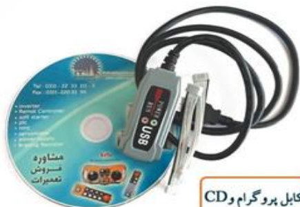
کابل پروگرام و CD